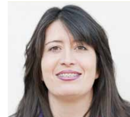
Por Victoria Rebage

las personas necesitamos para desarrollar una vida plena, una expresión sana de la afectividad, y para que esto sea posible debemos tener la información necesaria y adaptada a las situaciones personales y familiares en las que las personas con discapacidad intelectual se desenvuelven, deberemos considerar la afectividad y especialmente la sexualidad como un elemento más dentro de la atención a nuestros usuarios y familias para conseguir plenamente su integración y normalización. Durante el presente curso 2011-2012 dentro del servicio de Terapia Ocupacional del centro, se está desarrollando un programa de educación afectivo-sexual realizado con grupos de 6-8 personas y orientado a aquellos usuarios a los que a través de su programa individualizado de atención (PIA) se les ha detectado la oportunidad de incluirlos en este programa.