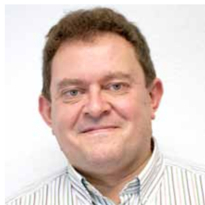
Por Agustín Garcés