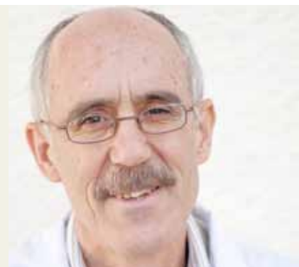
Por José Carlos Galán

El afecto es un proceso interactivo que involucra a dos o más personas y que incluye emociones, sentimiento y pasiones y en la mayoría de personas con discapacidad intelectual su expresión se produce en los entornos familiares y profesionales, y en muchos casos nos encontramos con el error de ignorar y creer que estas personas no tienen la necesidad de mostrar y recibir afectos en todas sus dimensiones. Si partimos de la premisa de que todas