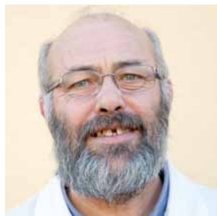
Por Miguel Ángel Aladrén