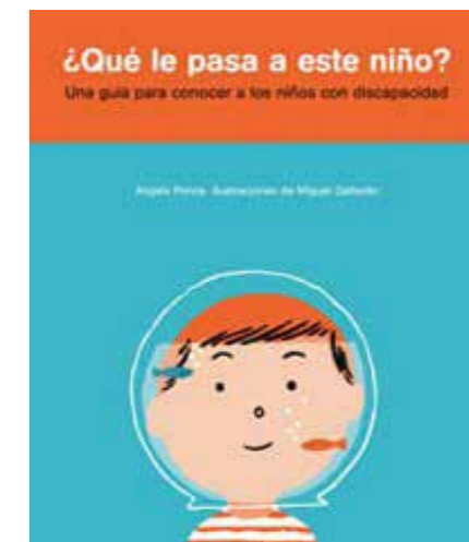
Título: ¿Qué le pasa a este niño? Autores: Miguel Gallardo y Àngels Ponce Edita: RBA Serres

¿Cómo se le cuenta a un niño que su hermano tiene Síndrome de Down? ¿Con qué palabras podemos explicar a un niño que es la parálisis cerebral? ¿Cómo conseguir que los más pequeños entiendan que a ellos se les riña y a un niño con autismo no, aunque hayan hecho lo mismo? Si a los adultos nos resulta complicado entenderlo y aceptarlo ¿cómo hacerlo fácil para los más pequeños? «¿Qué le pasa a este niño?» es un libro-guía especialmente indicado para padres, maestros, cuidadores y todas aquellas personas que se relacionan con niños que sufren alguna discapacidad o la viven de cerca, en hermanos, amigos o compañeros de colegio. El libro es muy ilustrativo y pedagógico y logra explicar de forma comprensible los límites y el comportamiento de estos niños, con ejemplos sencillos al alcance de lectores de todas las edades.