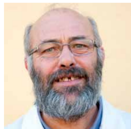
Por Miguel Ángel Aladrén