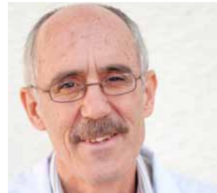
Por José Carlos Galán