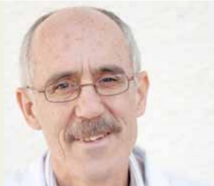
Por José Carlos Galán

tanto familiares, usuarios como trabajadores, tengamos claro que la dura travesía de cincuenta años ha servido para que las personas con discapacidad intelectual tengan su sitio en la sociedad. Tampoco habría que olvidar que en el mundo viven unos 350 millones de personas con alguna discapacidad que no disponen de los servicios mínimos para ayudarles a superar sus limitaciones; que el 80 % de ellas viven en zonas aisladas y que la mayoría unen a su discapacidad una extrema pobreza que les limita más aún el acceso a determinados recursos y en muchos casos el hecho de convivir con una discapacidad, les supone un estigma, un rechazo, un aislamiento y a veces el abandono más absoluto. Por todo ello, es un motivo de orgullo el poder trabajar, compartir el día a día y sentirse herederos de aquellas personas que lucharon desde principios