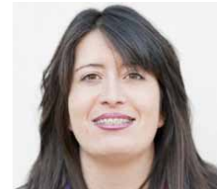
Por Victoria Rebage

de los años sesenta del pasado siglo por las personas con discapacidad intelectual, por hacerles un sitio en la sociedad y pusieron su ilusión en crear ATADES. Ellos abrieron el camino y nosotros debemos seguir trabajando por consolidar lo que se ha conseguido hasta ahora y buscar nuevos horizontes, nuevos retos, nuevos servicios.