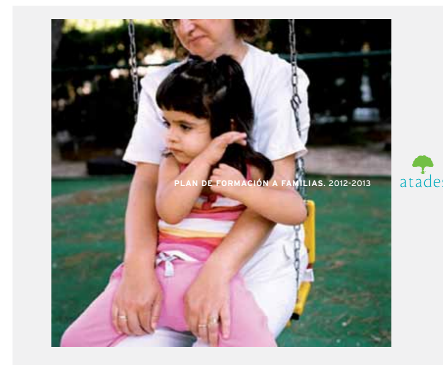
PLAN DE FORMACIÓN A FAMILIAS. 2012-2013