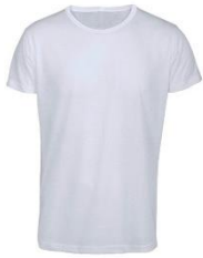
CAMISETA BÁSICA O TOTE-BAG