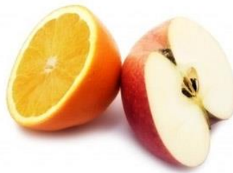
FRUTAS (NARANJA Y MANZANA)