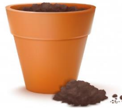
MACETA Y TIERRA