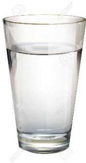
VASO CON AGUA