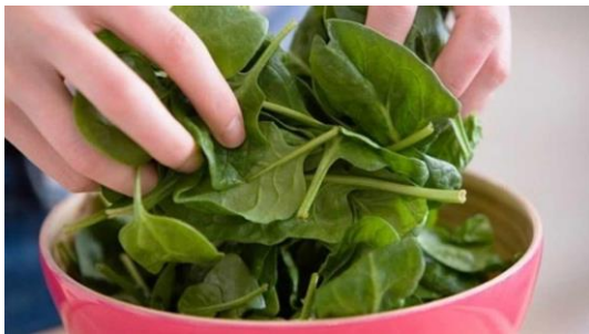
HOJAS DE ESPINACA FRESCA