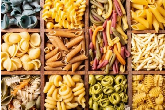
PASTA (de cualquier tipo)