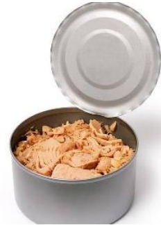
2 LATAS DE ATÚN